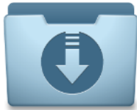
Cute PDF Writer